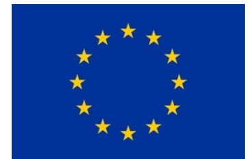
EU Emblem mit 12 Sternen